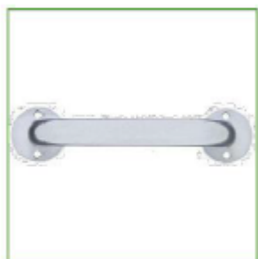
DETALHE DOS PUXADORES