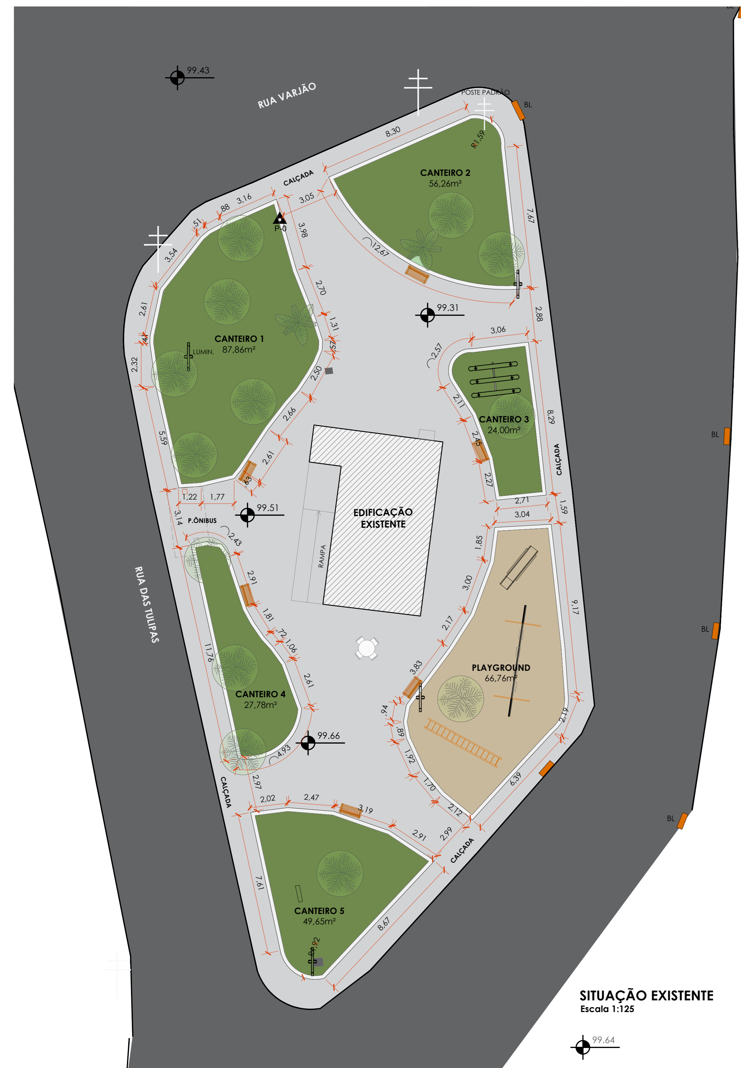
SITUAÇÃO EXISTENTE Escala 1:125