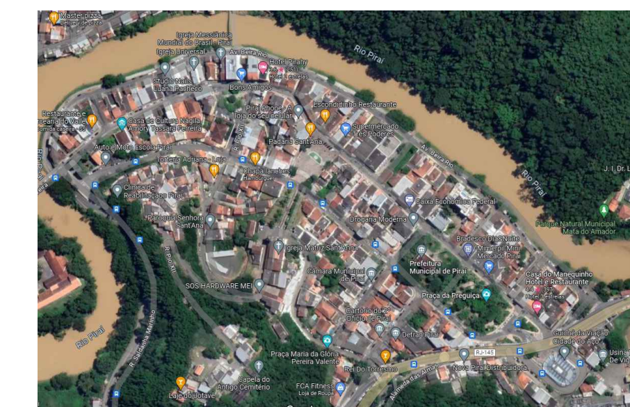
FOTO DE LOCALIZAÇÃO