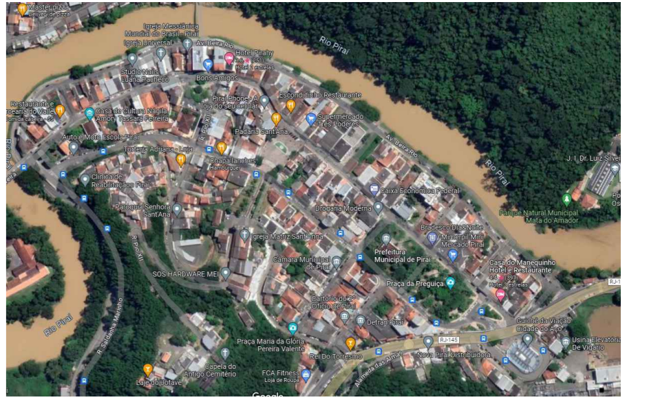
FOTO DE LOCALIZAÇÃO