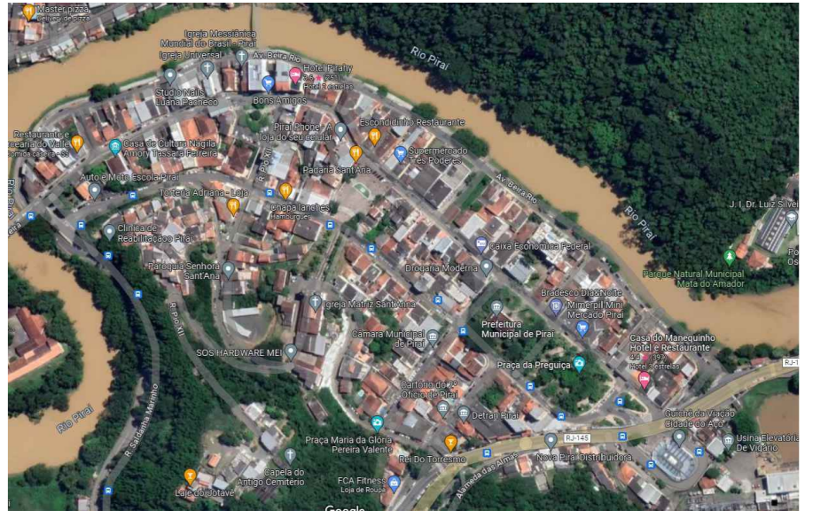
FOTO DE LOCALIZAÇÃO